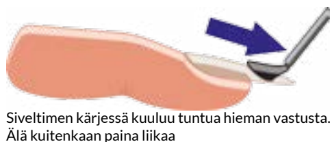
Siveltimen kärjessä kuuluu tuntua hieman vastusta. Älä kuitenkaan paina liikaa

Kovettamisen jälkeen alusgeeli kuuluu jäädä tahmeaksi. Älä koske pintaan sormin tai millään kemikaalilla. Voit suorittaa kuivapyyhkimisen, "dry-wiping", mikä tasoittaa tahmean pinnan. Käytä siihen kuivaa, tasakärkistä geelisivellintä. Tämä ei ole pakollinen vaihe. Voit myös levittää värillisen geelilakan suoraan alusgeelin päälle.