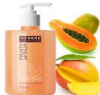
Noname Cosmetics käsisaippua.

Lue tämä käyttöohje huolellisesti kokonaisuudessaan ennen tuotteiden käyttöönottoa. Mikäli tästä ohjeesta jää jotain epäselvää, ota yhteyttä asiakaspalveluumme.